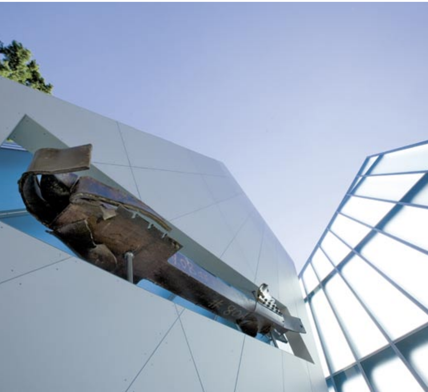
Monumento "Memoria e Luce" di Daniel Libeskind - Padova